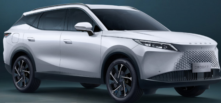
KHAKI WHITE (BW)