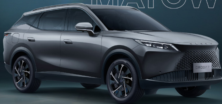
MATTE GRAY (UK)