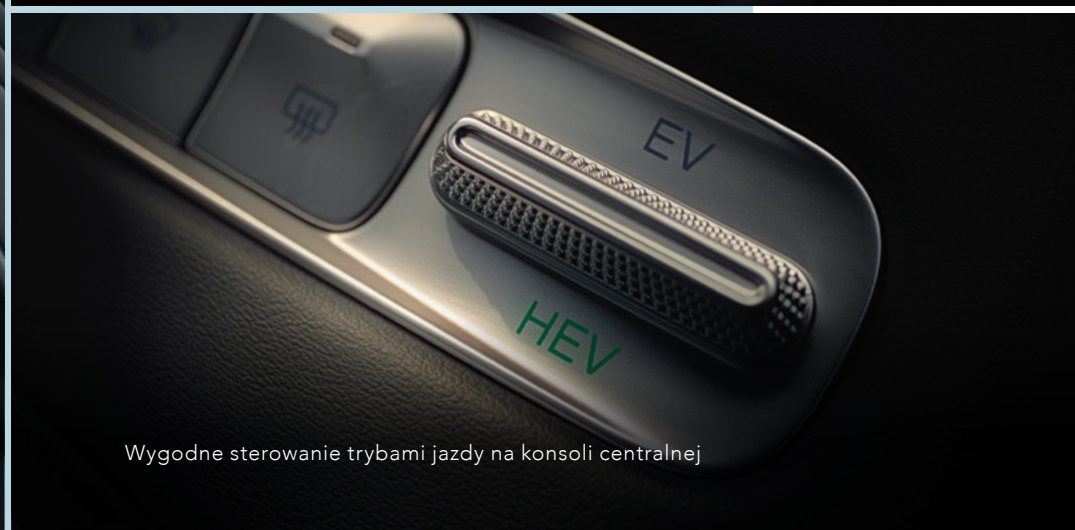
Wygodne sterowanie trybami jazdy na konsoli centralnej