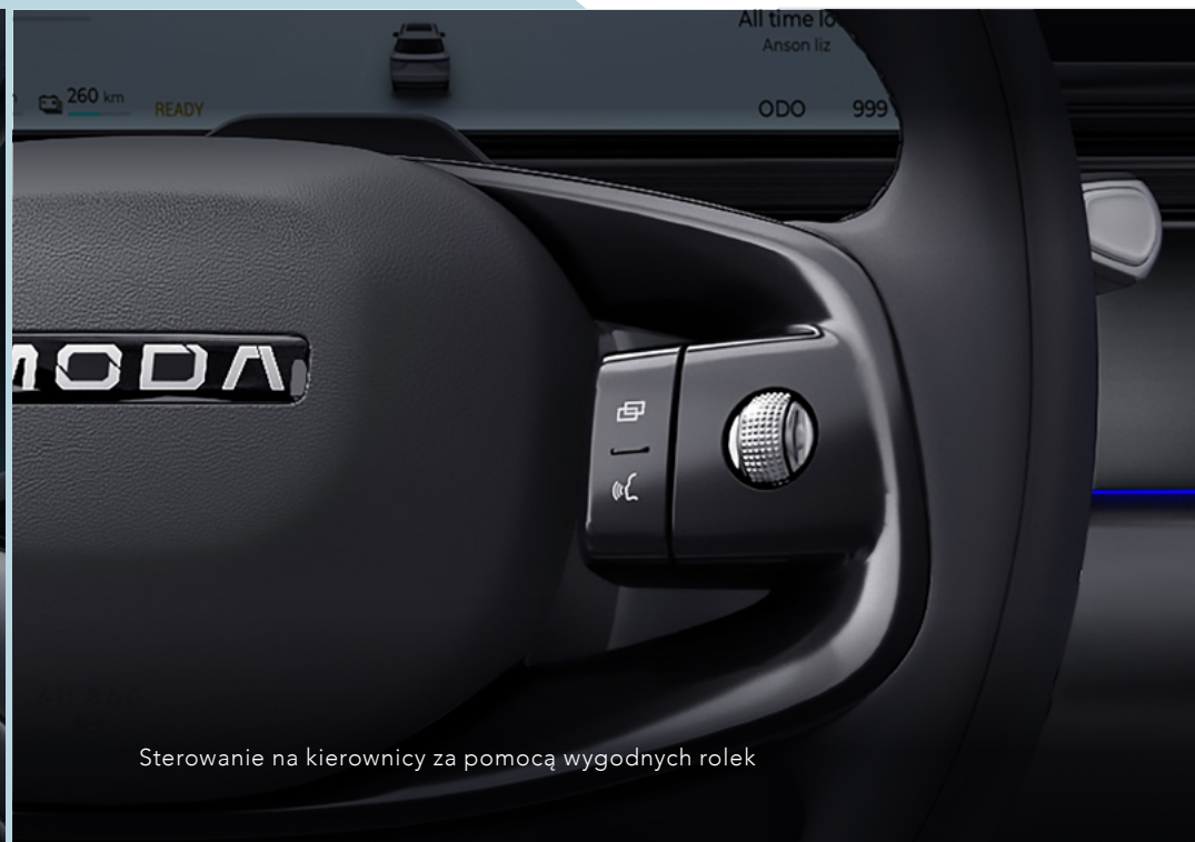
Sterowanie na kierownicy za pomocą wygodnych rolek